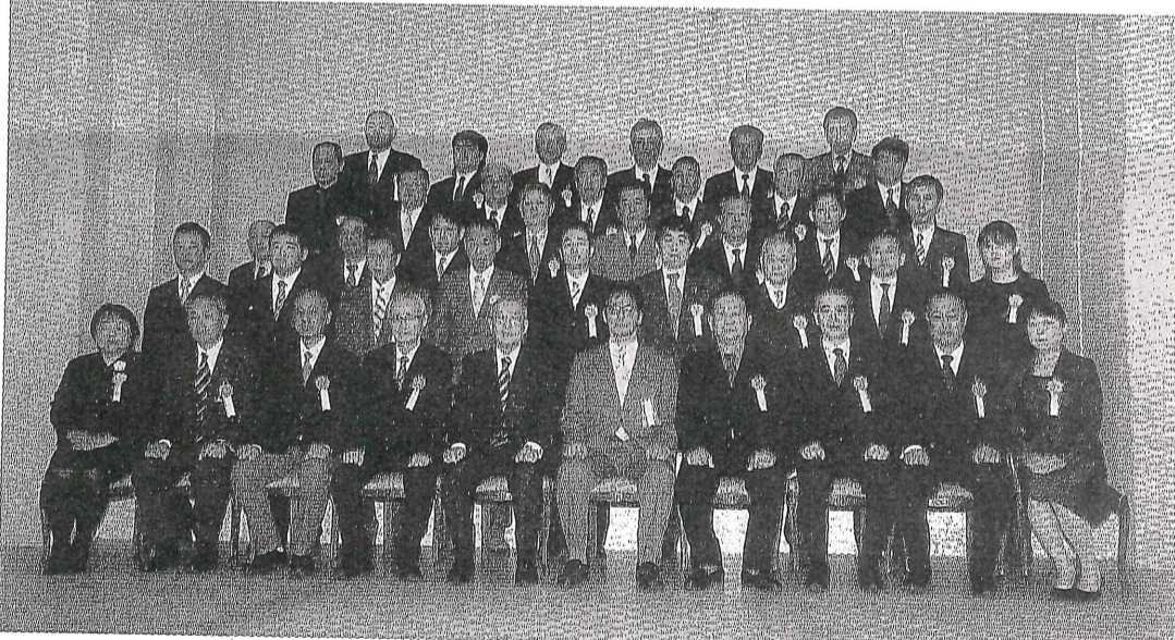
永年勤続者功勞表彰式受賞者(役員の一部及び従業員の部)

一方、14年度に県が発注した公共工事の品質確保と施工技術向上の観点から、会員企業に在籍する技術者の模範となる工事を施工し、先に県知事表彰を受けた県優良工事主任技術者に対しては「優良工事の知事表彰は、勤務されている会社のみならず、私ども協会会員、県内企業の技術力に対する評価を高めるものであり、心からお祝いを申し上げます」と述べた。